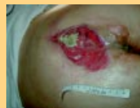
Ulcer nach 2 Behandlungswochen.