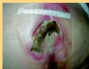
Ulcer zu Beginn der Behandlung.