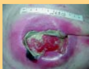
Ulcer zu Beginn der Behandlung