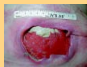
Ulcer nach 1 Behandlungswoche. Es liegt keine Geruchsbelastung mehr vor.