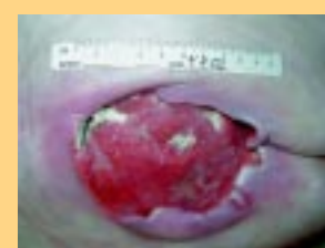
Nach 4 Behandlungswochen weist das Ulcer gesundes Granulationsgewebe mit Heilungstendenz auf.

Diese 87-jährige Frau hatte seit 1 Monat einen Dekubitus 3.-4. Grades. Das Ulcus befand sich über dem Kreuzbein und wurde zuvor standardmäßig mit Produkten zur feuchten Wundheilung behandelt.