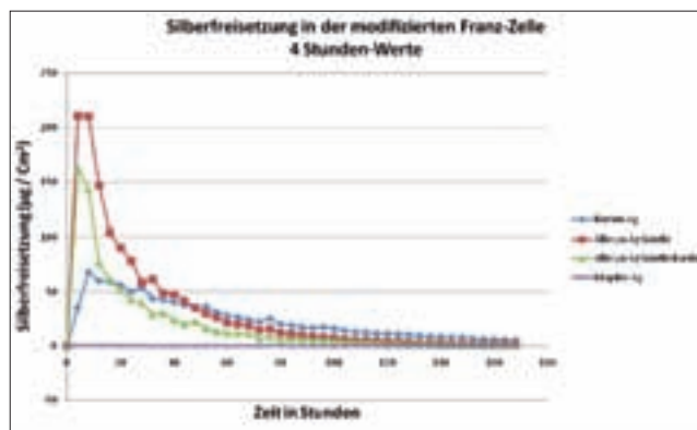
Abbildung 2 Die alle 4 Stunden gemessene freigesetzte Menge an Silberionen der geprüften Wundauflagen.

Die Abbildung 2 zeigt die Silberfreisetzungsraten und Abbildung 3 die kumu-