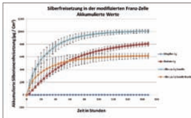
Abbildung 3 Die akkumulierte Freisetzung der Silberionen der geprüften Wundauflagen.